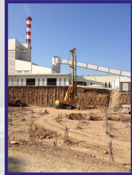
Düzce Cam Projesinde 11.000 m Ø100 lük temel altı fore kazık başarıyla tamamlanmıştır.