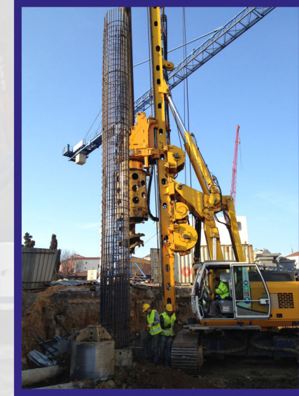
Bilecik Hızlı Tren Projesinde 10.000 mØ120lik,15.000 m Ø100 lük temel altı fore kazık başarıyla tamamlanmıştır.